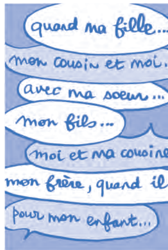
Les groupes de parole, des lieux pour échanger aussi sur ces questions.

Mireille Ventura, coordinatrice d' insiemeVaud , © dessin Helen Tilbury